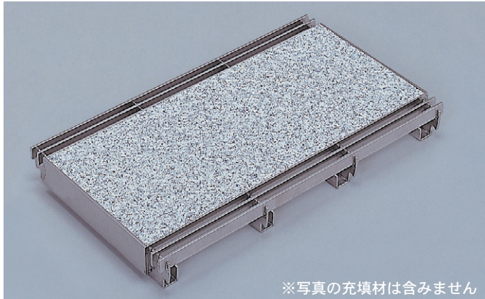
※写真の充填材は含みません